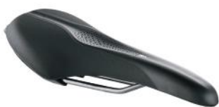
SATTEL S Der sportliche Sattel