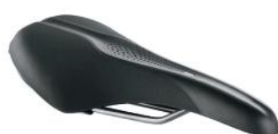
SATTEL M Der Allrounder Sattel