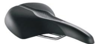
SATTEL L Der besonders bequeme Sattel